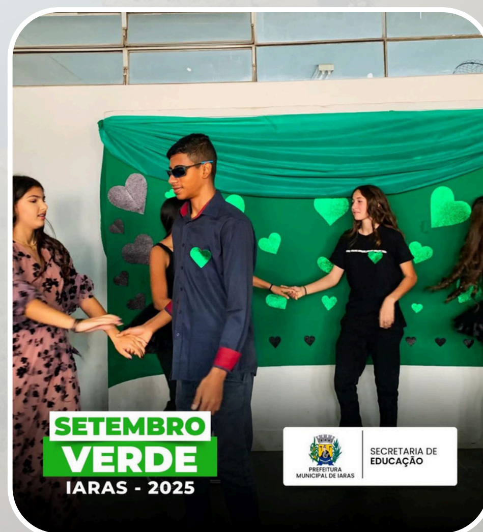
Campanha Setembro Verde EMEF Profª Julieta Buchdid Carvalho