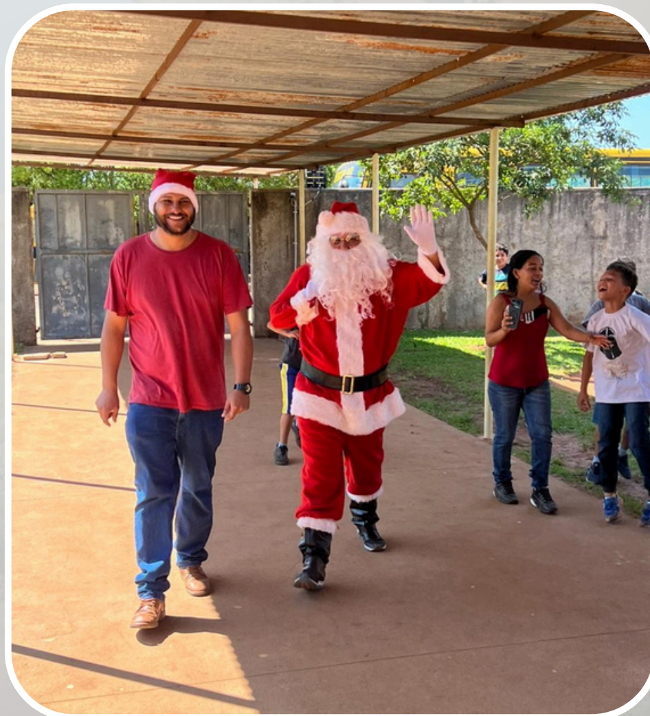
Chegada Papai Noel EMEIEF Assentamento Zumbi dos Palmares