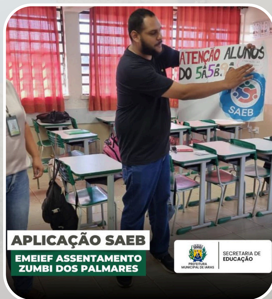
Dinâmicas - Aplicação SAEB EMEIEF Assentamento Zumbi dos Palmares