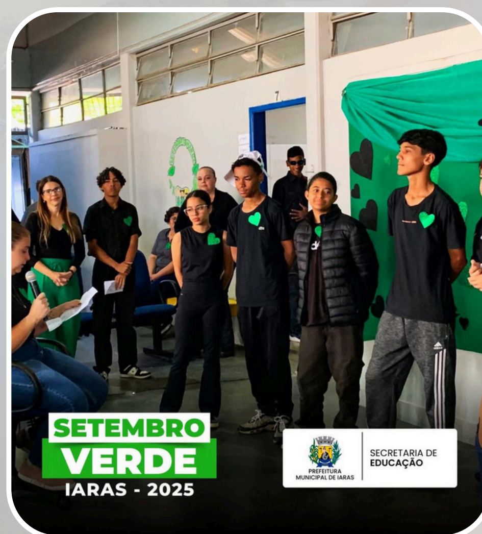
Campanha Setembro Verde EMEF Profª Julieta Buchdid Carvalho