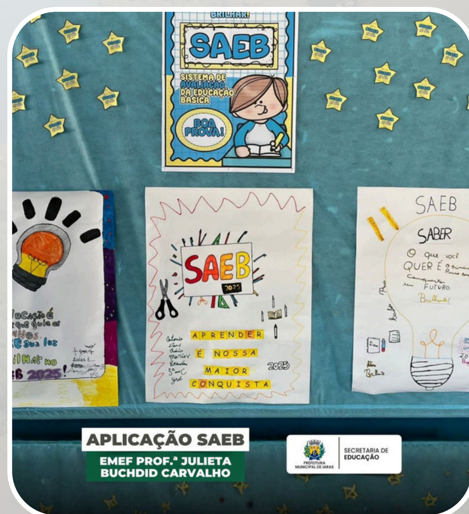
Mural - Aplicação SAEB EMEF Profª Julieta Buchdid Carvalho