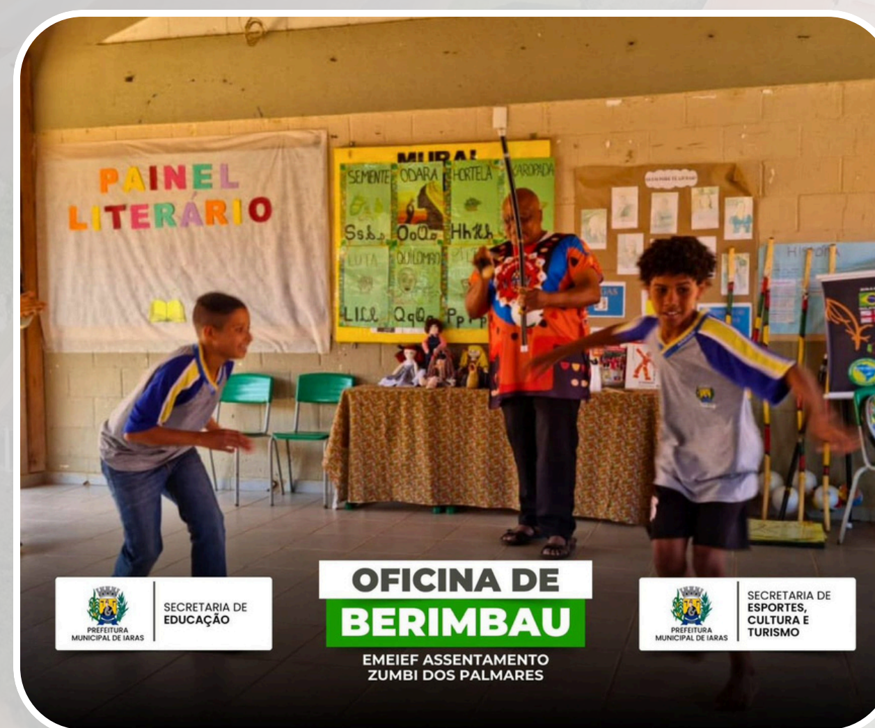
Oficina de Berimbau EMEIEF Assentamento Zumbi dos Palmares