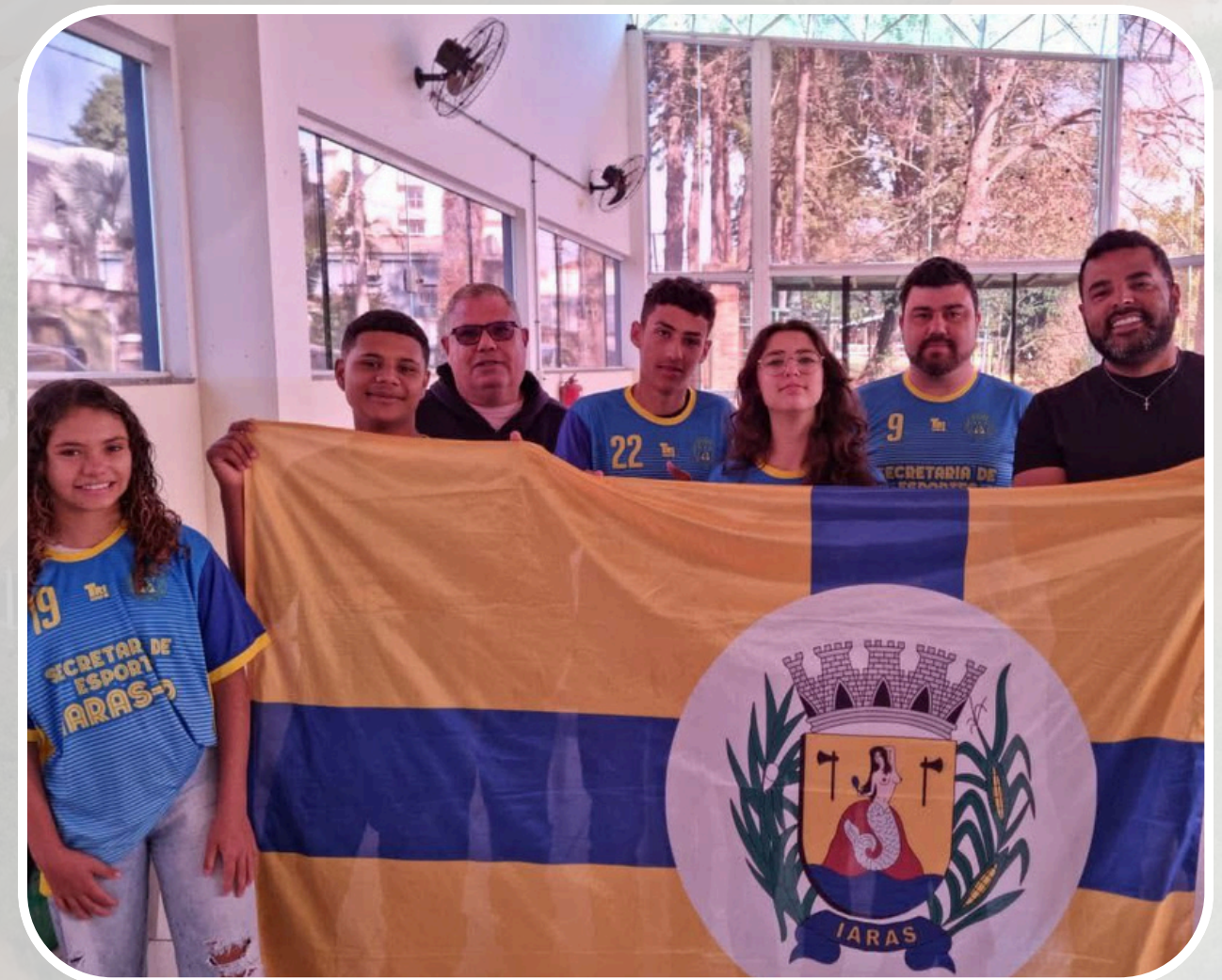
Participação - Xadrez e Damas Olimpíadas Santabarbarenses