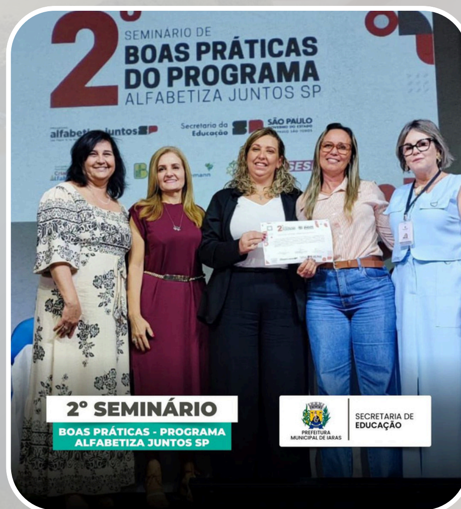
Participação - 2º Seminário Boas Práticas do Programa Alfabetiza Juntos SP