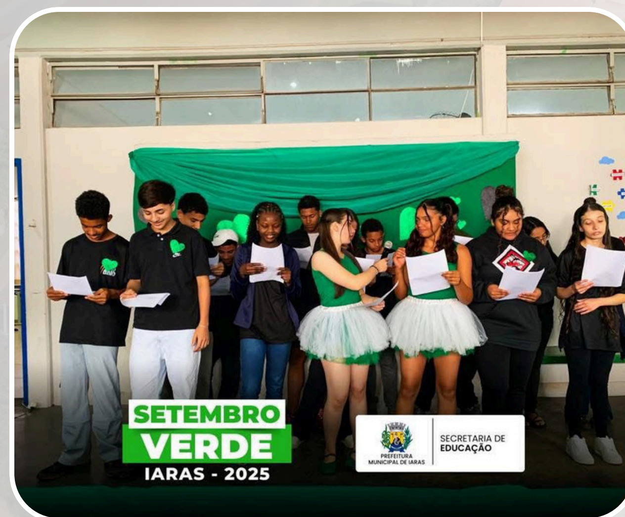
Campanha Setembro Verde EMEF Profª Julieta Buchdid Carvalho