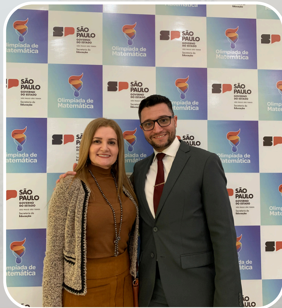
Participações em Reuniões com Dirigente Regional de Ensino