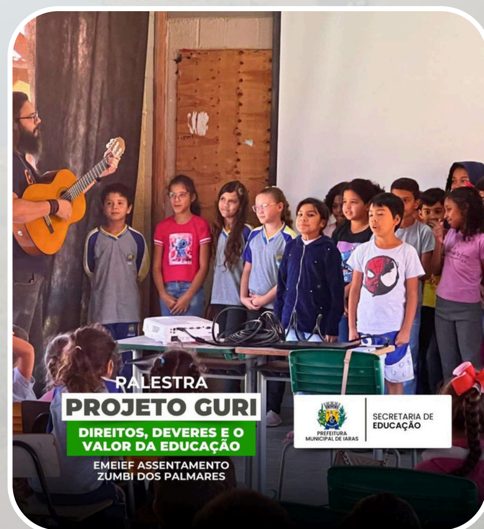
Palestra - Projeto Guri EMEIEF Assentamento Zumbi dos Palmares