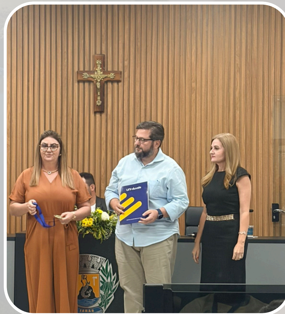
Entrega das Medalhas e Bolsas de Estudos para os melhores alunos