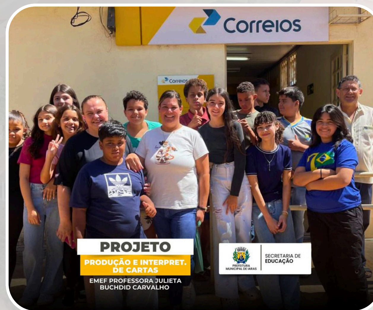
Projeto - Produção e Interpretação de Cartas EMEF Profª Julieta Buchdid Carvalho