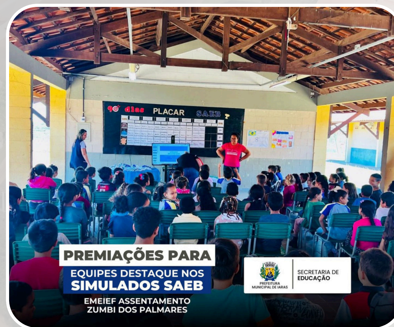
Premiações - Destaques SAEB EMEIEF Assentamento Zumbi dos Palmares