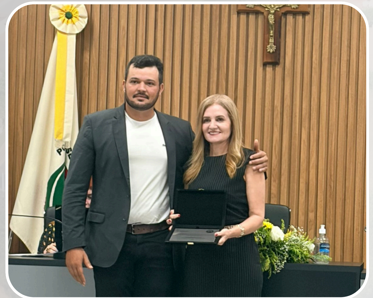
Entrega das Medalhas e Bolsas de Estudos para os melhores alunos