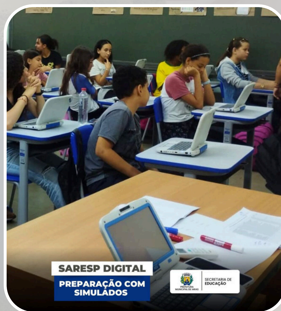
SARESP Digital - Simulados EMEF Profª Julieta Buchdid Carvalho