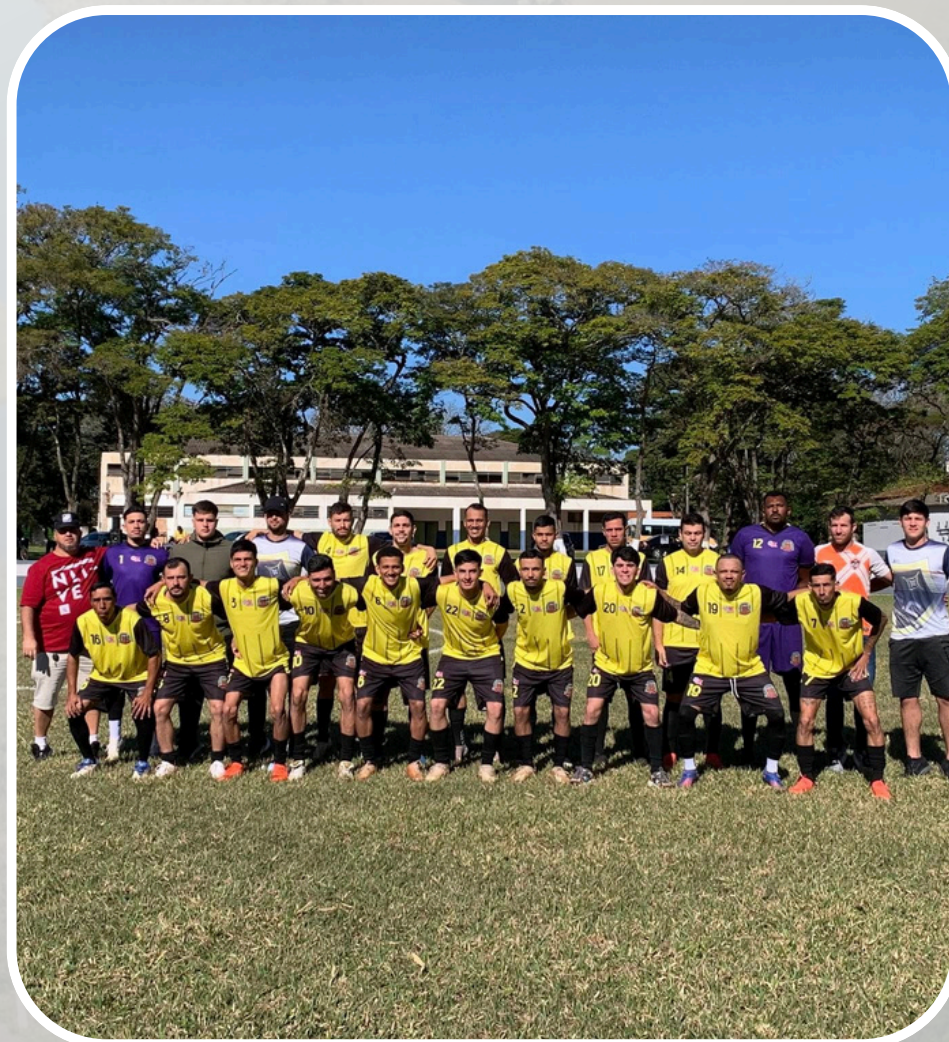
1º Campeonato de Futebol Eliminatório Intermunicipal Iaras 2025