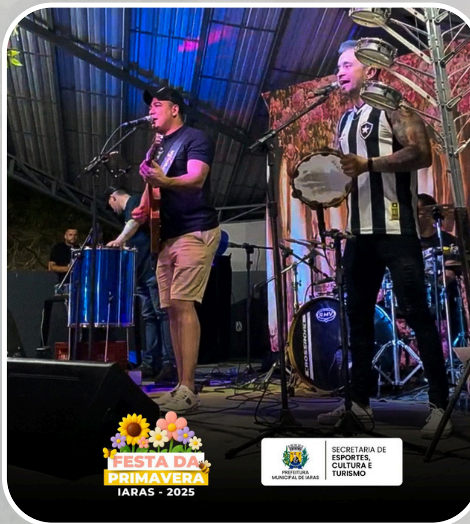
Festa da Primavera Iaras 2025