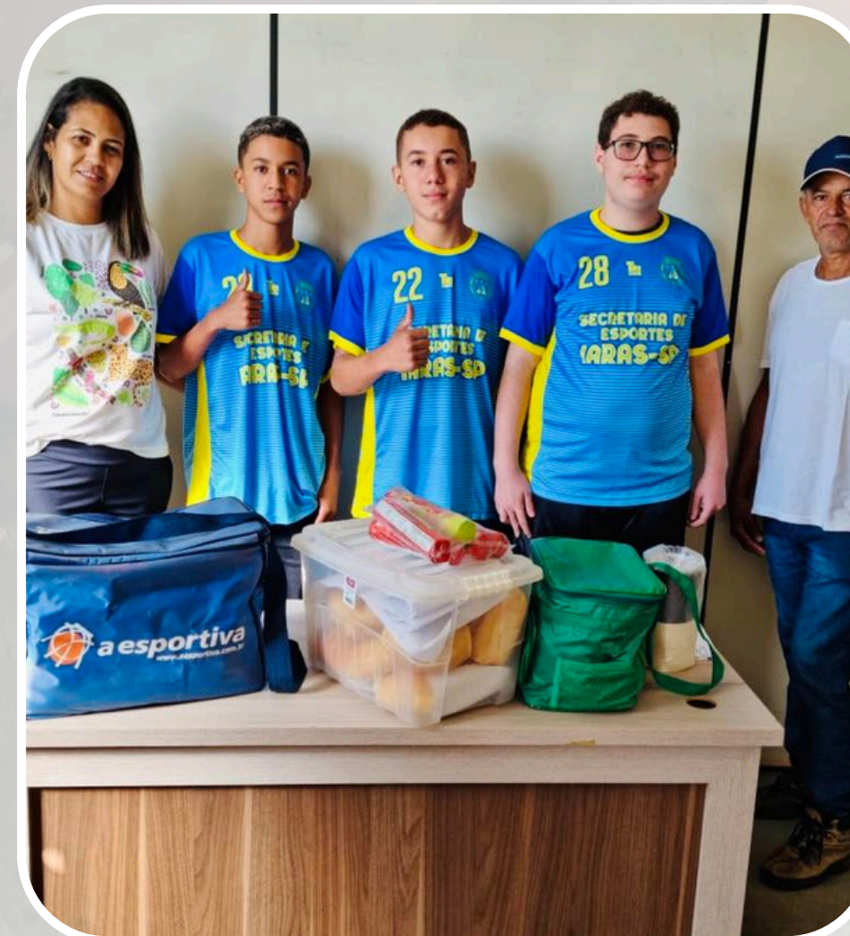
Participação na 8ª Etapa da Liga Enxadrista