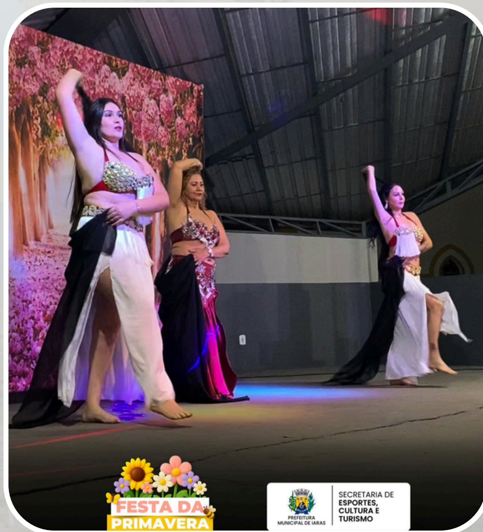
Festa da Primavera Iaras 2025