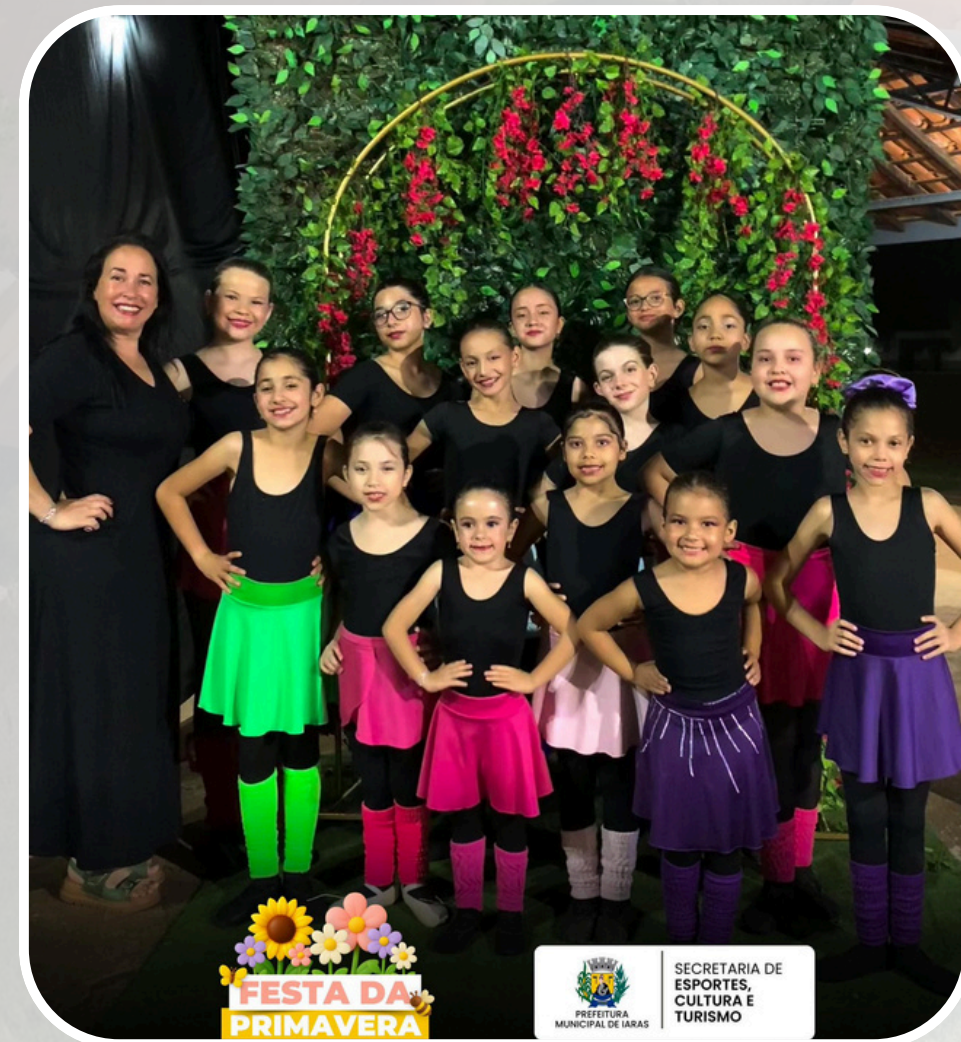
Festa da Primavera Iaras 2025