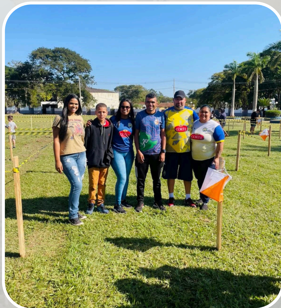
1ª Corrida de Orientação (parceria com a FOSP)