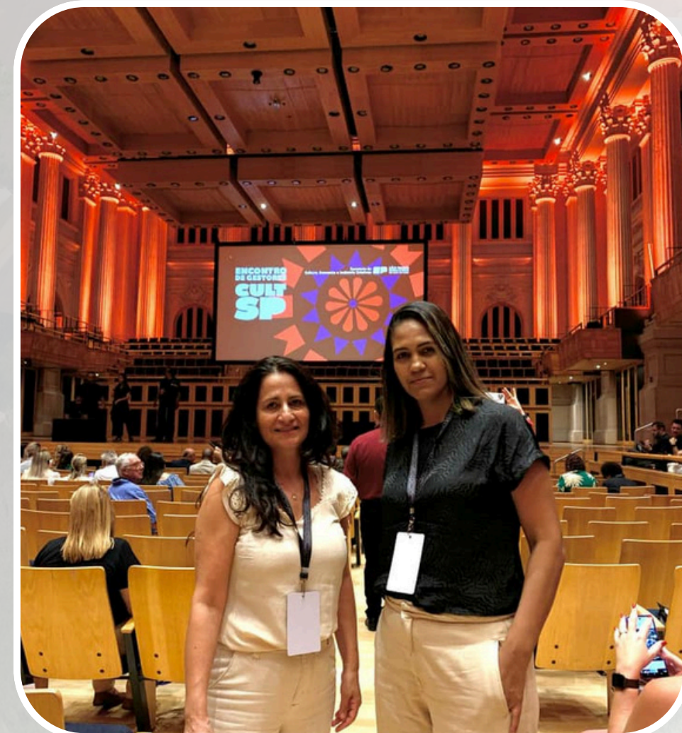
Participação no Encontro de Gestores da CULT SP