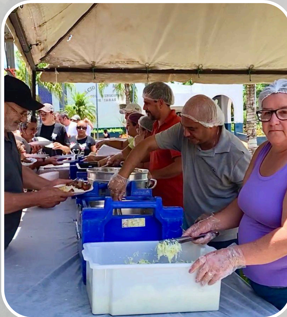
Festividades do Aniversário da Emancipação do Município (Sem utilização de recursos do orçamento público)