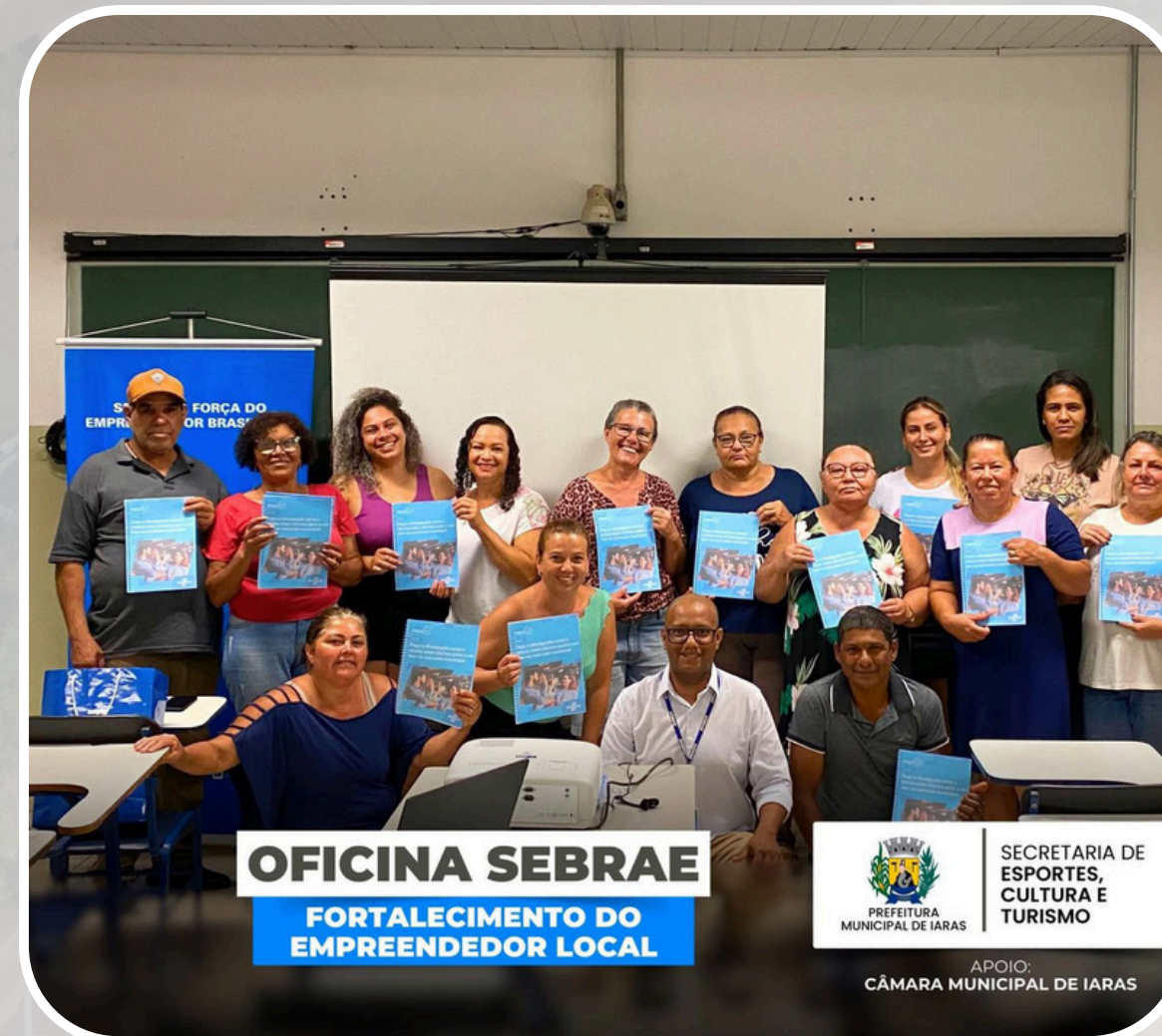
Oficina SEBRAE - Fortalecimento do Empreendedor Local