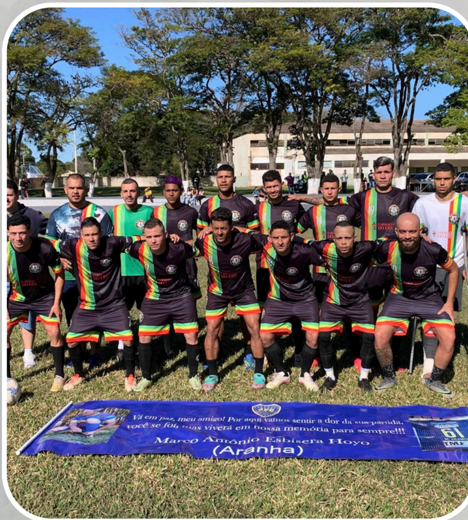
1º Campeonato de Futebol Eliminatório Intermunicipal Iaras 2025