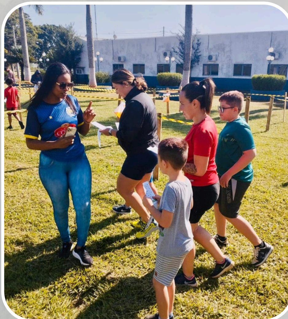
1ª Corrida de Orientação (parceria com a FOSP)