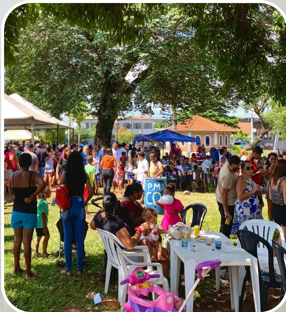
Festividades do Aniversário da Emancipação do Município (Sem utilização de recursos do orçamento público)