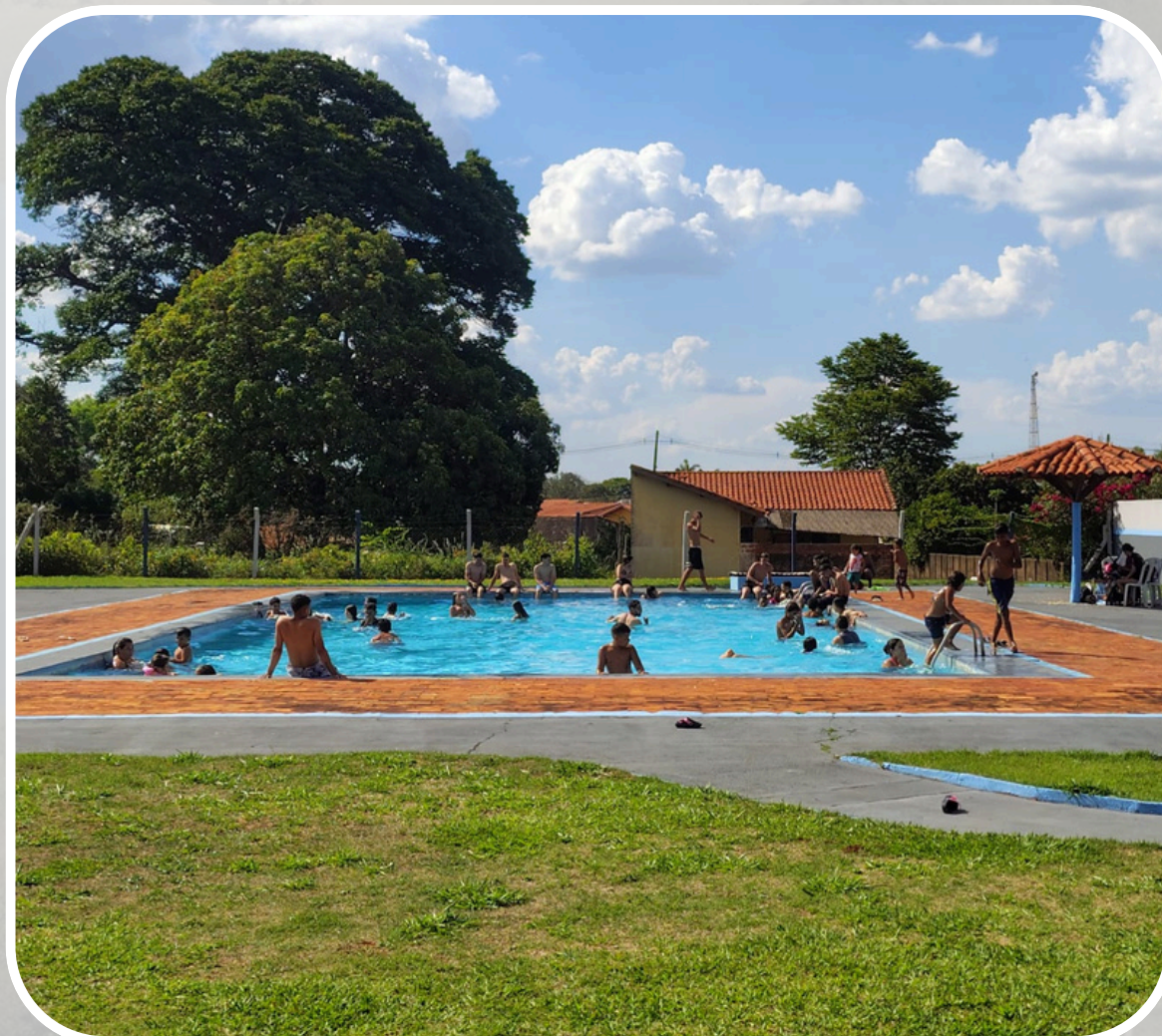
Reabertura da Piscina Municipal (com a contratação de Salva Vidas)