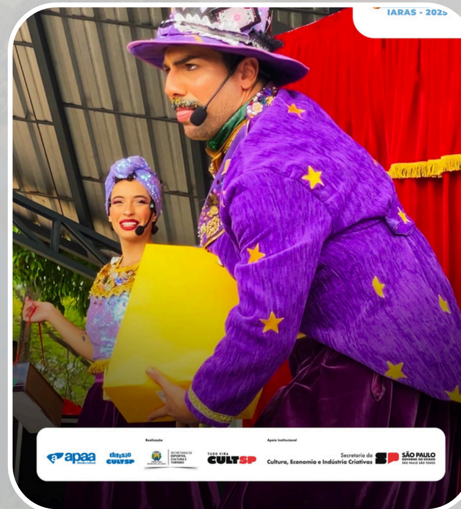
Festa do Dia das Crianças (parceria com a APAA)