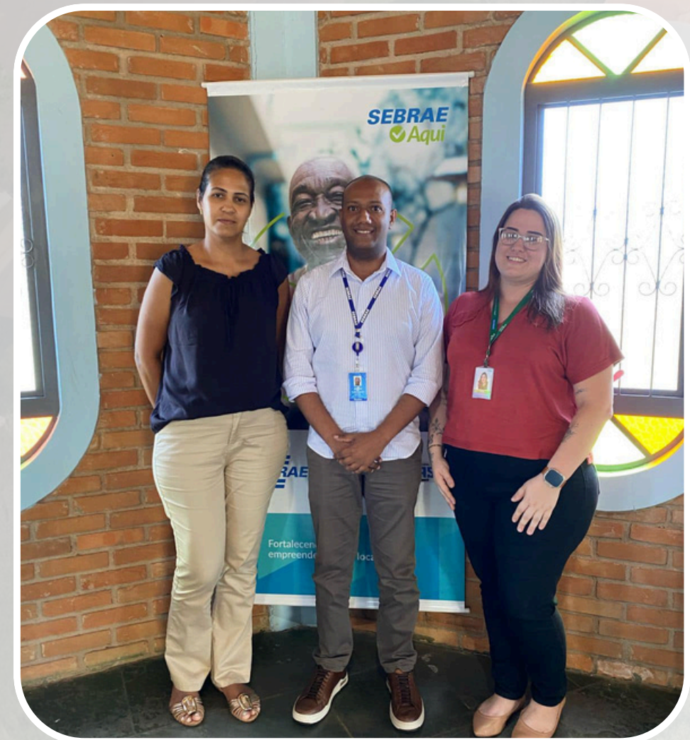
Parceria com o SEBRAE para fortalecimento do setor de artesanato