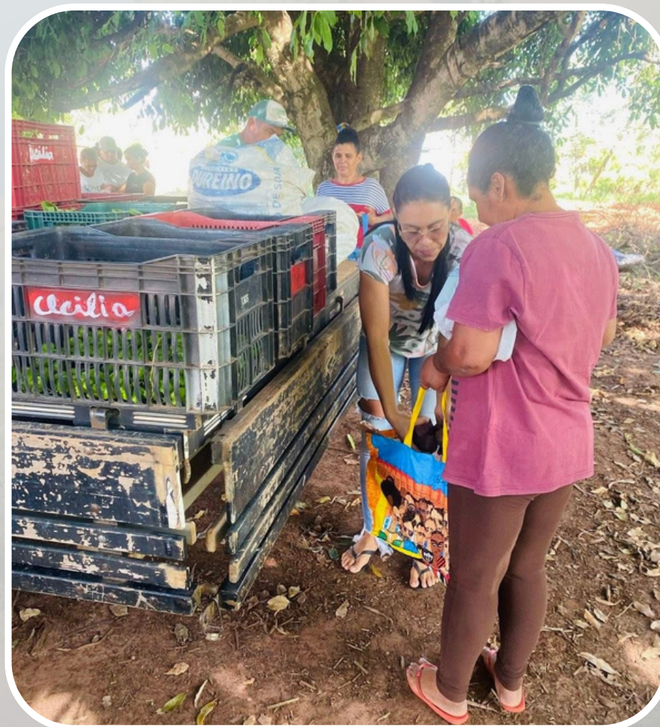
Entrega das Verduras