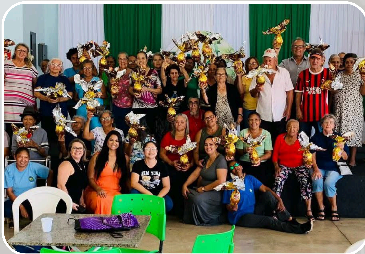
Evento Páscoa - SCFV