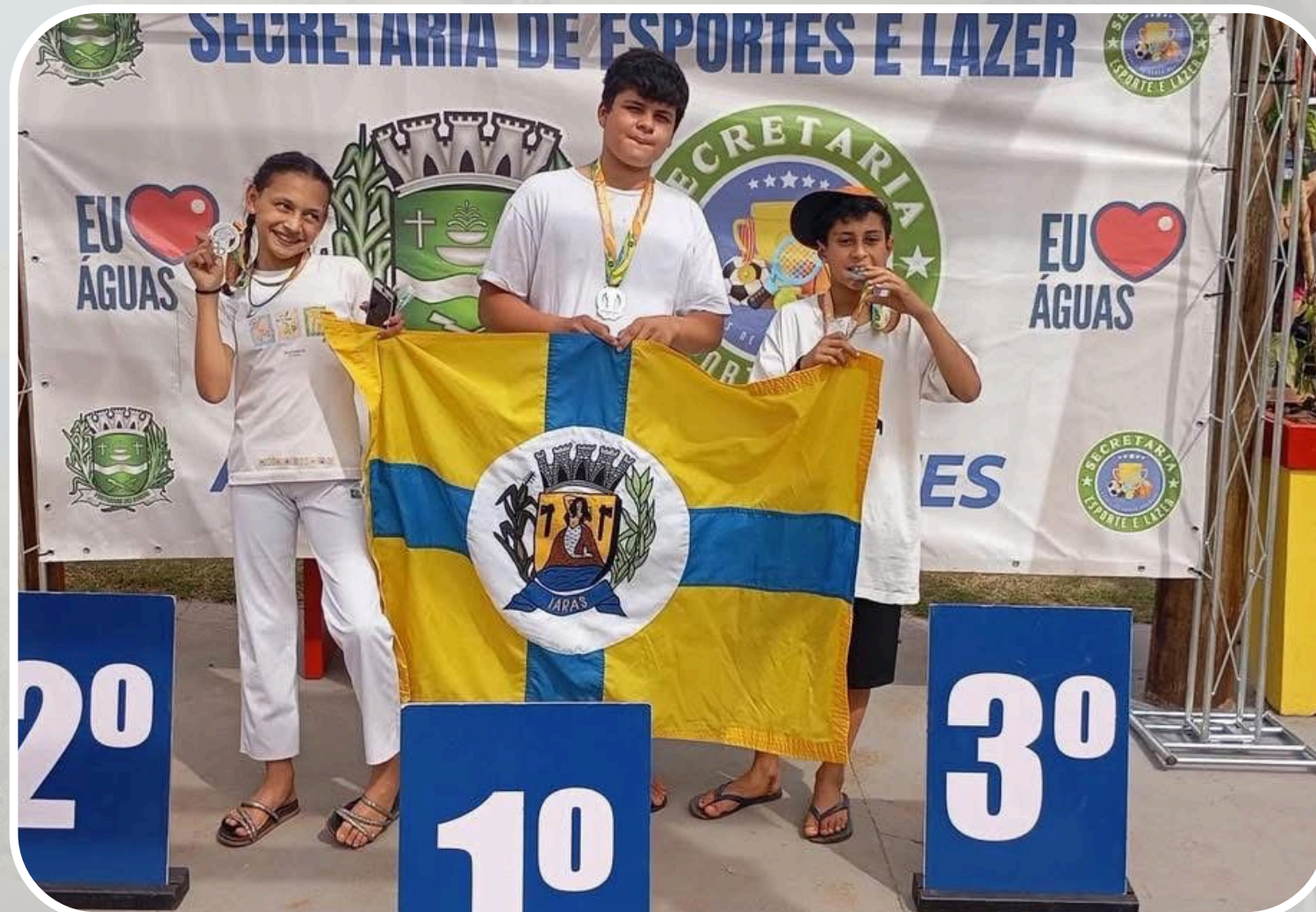
Medalhistas Capoeira - Olimpíadas Santabarbarenses