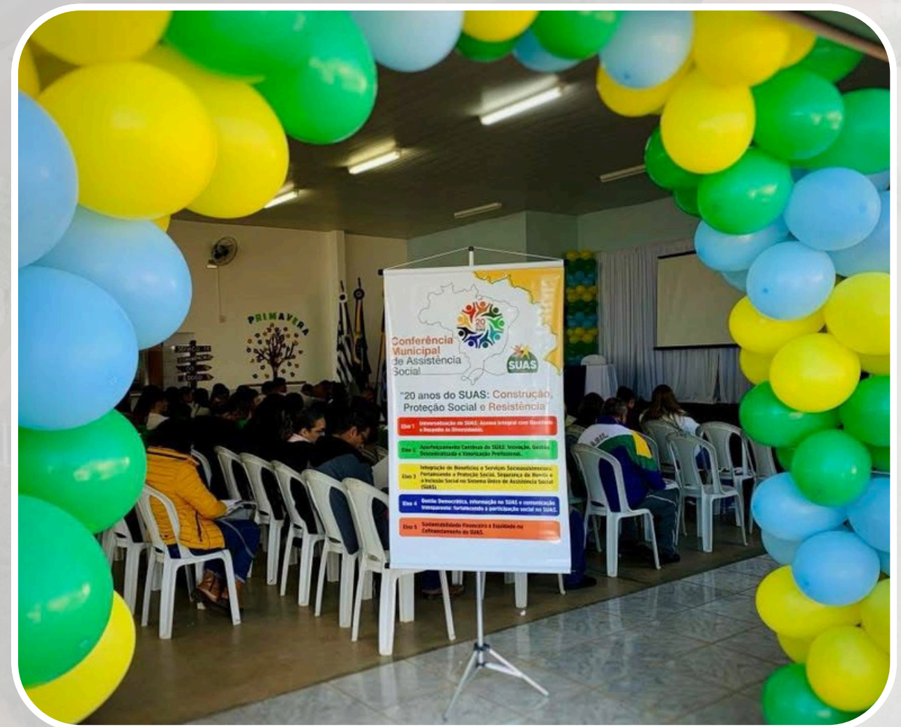
12ª Conferência Municipal de Assistência Social