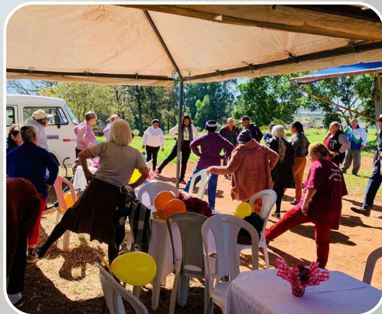
Evento 18 de Maio - SCFV