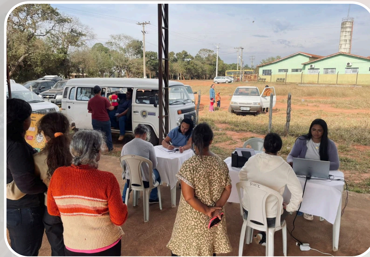
CRAS no Assentamento Zumbi dos Palmares