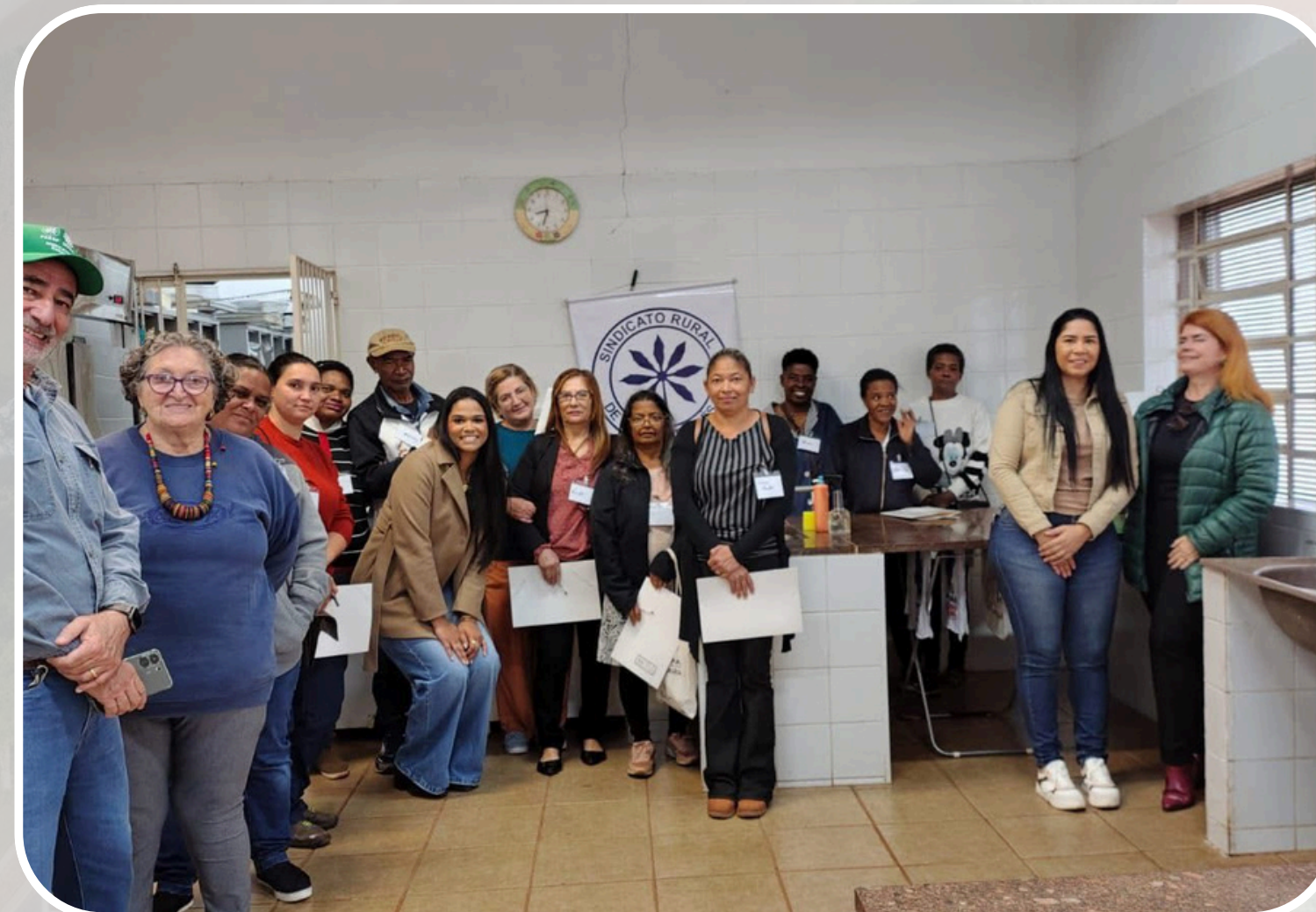
Curso - Sindicato Rural