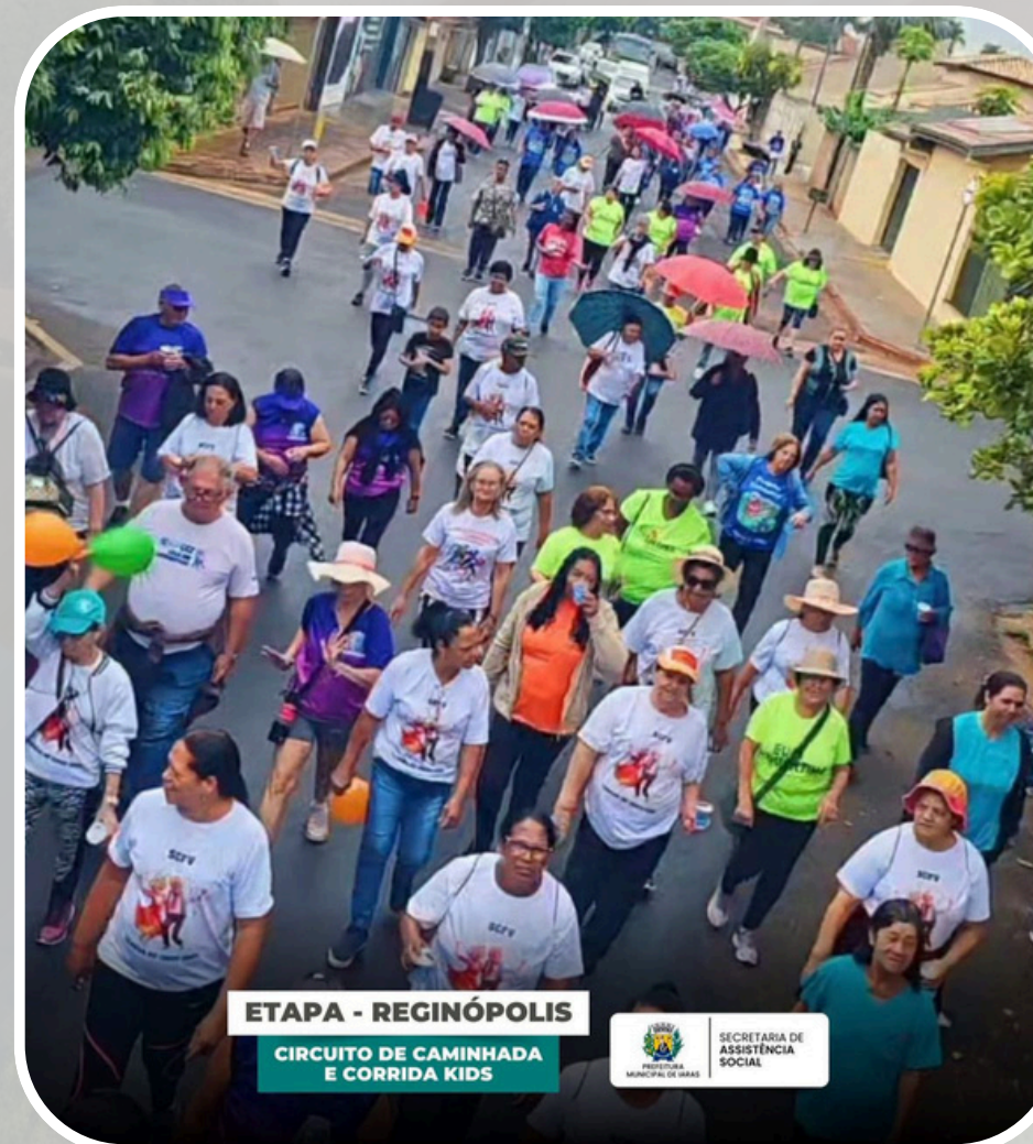
Circuito de Caminhada e Corrida Kids - Reginópolis