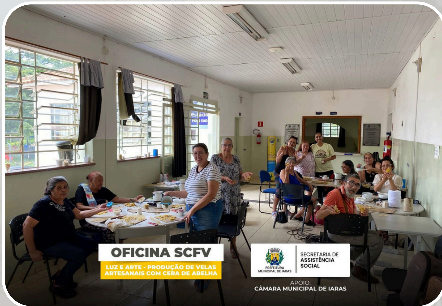
Oficina Produção de Velas com Cera de Abelha - SCFV